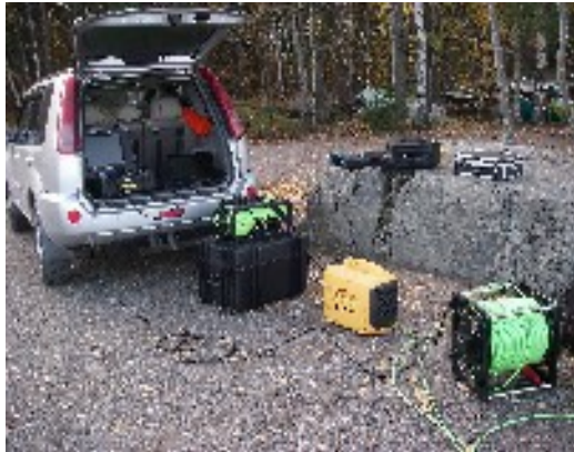
ROV nopea ja helppo siirtää.